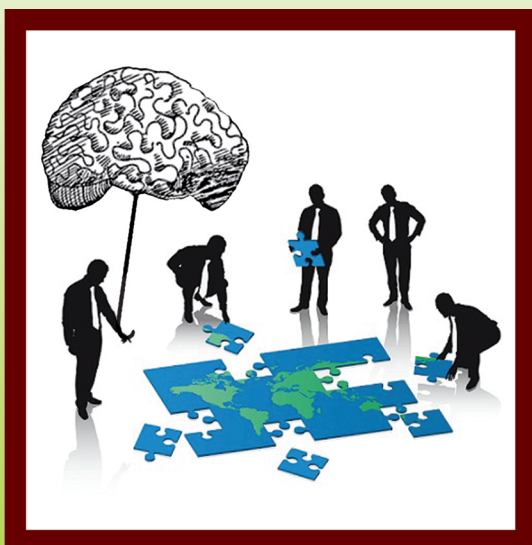
تأثیر سرمایه‌ی فکری بر عملکرد سازمان (۴۷)