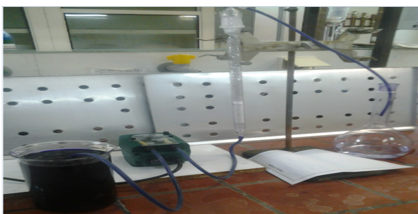
شکل (۱) طرح کلی ستون بستر ثابت در مقیاس آزمایشگاه دولومیت اصلاح شده (گرم) در ستون است [۴].

در این معادله Q ، t_{tot} و A_2 به ترتیب کل زمان انجام فرآیند (دقیقه)، شدت جریان حجمی (میلی لیتر بر دقیقه) و سطح زیر منحنی نقطه شکست است. همچنین میزان ظرفیت جذب تعادلی از معادله (۲) محاسبه می شود. در این معادله مقدار جرم جاذب